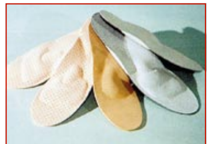
Egyedi modulrendszerű talpbetétek

cióra. Felnőtt korban erre kevesebb az esély, ekkor sem a beavatkozást javasolják, hanem a megfelelő talpbetét és a masszázs a megoldás.